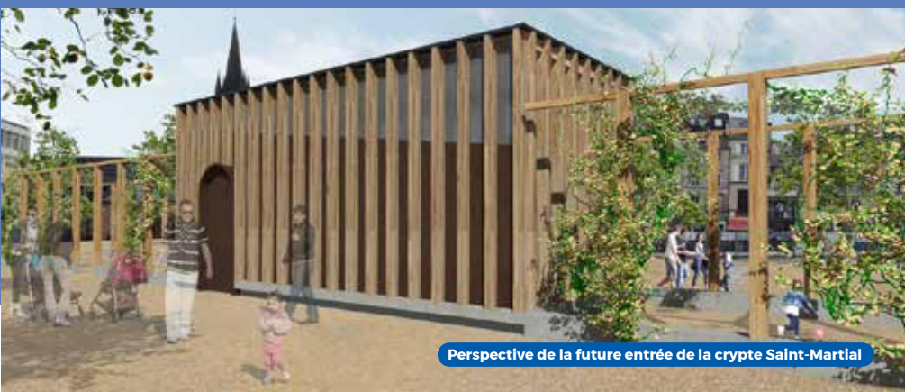
Perspective de la future entrée de la crypte Saint-Martial

En amont des travaux de la future Halle République, un aménagement temporaire sera réalisé sur la partie ouest du site. Une treille végétalisée, des arbres fruitiers et de grandes tables inviteront à la détente, avec un petit espace pour les enfants. L'accès à la crypte Saint-Martial sera également aménagé. À l'issue des travaux, l'ensemble des arbres et du mobilier sera réutilisé dans d'autres espaces publics en ville ! À l'est du site, la base vie du chantier de la phase 2 sera installée.