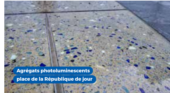
Agrégats photoluminescents place de la République de jour

arbres, des assises en porcelaine sont disposées, tandis que des barrettes de céramique ornent les kiosques d'entrée du parking souterrain. Vous l'aurez compris, la valorisation des savoir-faire et matériaux régionaux est au cœur du projet , avec l'intégration d'éléments de céramique pour porter haut et fort l'identité de Limoges.