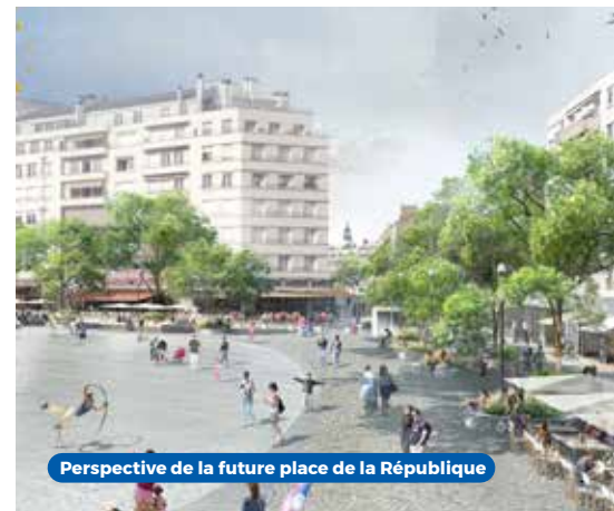
Perspective de la future place de la République

Autour de la place et dans les rues, 33 jardinières en granit sont actuellement déployées pour accueillir les arbres de la future lisière arborée. Pour créer ces espaces verts, 9 fosses d'arbres ont été insérées dans le parking tels de grands bacs de fleurs , avec un volume idéal pour une belle croissance des végétaux. Sur la place, au niveau des trois courbes les plus prononcées de l'anneau, des dispositifs de brumisations sont en cours d'installation. S'il est difficile de se représenter leurs bienfaits en plein hiver, soyez sûrs qu'ils vous apporteront toute la fraîcheur dont vous aurez besoin cet été !