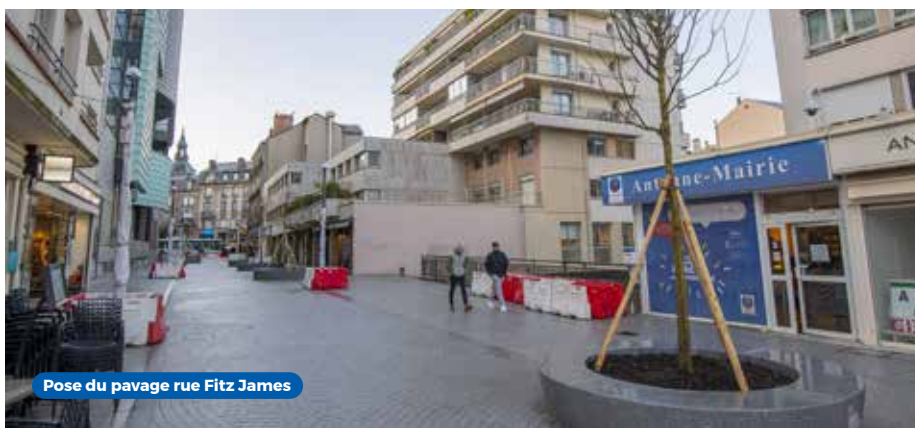
Pose du pavage rue Fitz James