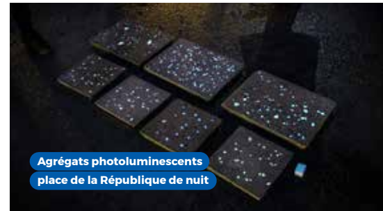
Agrégats photoluminescents place de la République de nuit

Retrouvez les reportages TV de 7ALimoges sur placerepublique.limoges.fr / Le chantier en direct